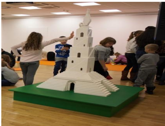
Rekonstrukcja pomnika Wieży Babel Abrahama Ostrzegi w Zachęcie zbudowana z 10 tys. klocków LEGO.